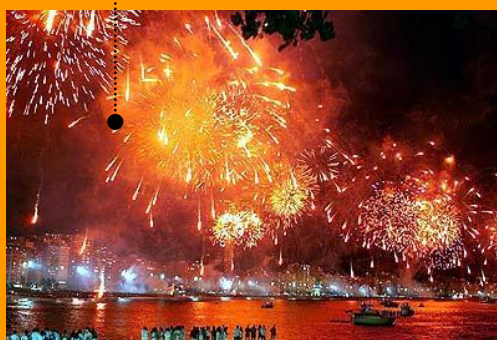
Copacabana, RJ, 1º de janeiro de 2000: 18 minutos de fogos para celebrar as esperanças de um "novo milênio"...

de "balanço positivo". O que vale é a volta da dignidade, a volta da possibilidade de se exercer um serviço importante com condições de atender às expectativas da população. Se eu, particularmente, fosse Oficial Titular de alguma serventia, de certo colocaria um cartaz enorme na parede para avisar aos meus usuários da chegada da Lei Áurea. Mas também concordo com aqueles que vão continuar a trabalhar sem