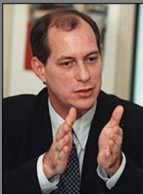
Ciro Gomes: "não me intimidarei diante da arrogância ou do constrangimento antidemocrático e autoritário, vindo do Governo do Sr. FHC ou de seus áulicos"

Ao tomar conhecimento do temário do próximo Congresso de Registro Civil, a ser realizado em Vitória/ES (6 a 8 de setembro), fiquei impressionado com a possibilidade de se ter ali reunidos dois candidatos à presidência da república. Caso venha a se confirmar, será um