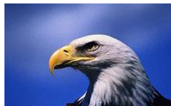
Águia: mudança para continuar sobrevivendo.

o novo tem seu apelo. Ver uma iniciativa - seja um grande projeto ou uma pequena medida - dar resultados a partir de um "insight" é realmente muito gratificante. Já aconteceu aqui na DeMaria e creio que possa acontecer com vocês, desde que comecem a ficar mais abertos às novidades. Para quem trabalha com informações, registro e documentos estar alheio ao que se passa no mundo do direito, da tecnologia da informação, internet, comunicações, etc., pode ser perigoso. O serventuário deve se manter "antenado" para que esteja preparado para absorver as mudanças, o mais breve possível. Se puder influir nas mesmas ou antecipá-las, melhor ainda. E esteja certo que a regra para o mundo empresarial é a mesma da natureza, onde só sobrevivem aqueles seres com maior grau de adaptabilidade. O caso da águia é emblemático. Trata-se da ave que vive mais tempo, cerca de 70 anos. Possui resistência, visão apurada e capacidade de renovação. Sua história de vida é peculiar: por volta dos 40 anos fica com as penas velhas e grossas, o bico e as unhas compridas e curvas demais, condição que a impede de voar, de agarrar a presa e, conseqüentemente, de se alimentar. Nessa situação ela tem duas escolhas a fazer: morre ou enfrenta um lento e doloroso processo de mudança, que dura cerca de cinco meses. Com coragem e resignação, ela se isola num penhasco e inicia a luta pela sobrevivência que levará a uma total transformação. Bate o bico contra as rochas até