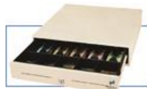
Gaveta de dinheiro Bematech

car documentos, emite comprovantes e recibos em até três vias. Utilizada em qualquer operação que necessite a impressão de ticket, está adequada ao uso nos cartórios e pode também trabalhar em conjunto com gaveta de dinheiro, numa aplicação típica de caixa.