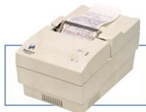
Impressora Bematech MP-20MI

Para os usuários do módulo Financeiro do DOC que queiram imprimir recibos, recomendamos o uso das miniimpressoras Bematech. O modelo MP-20MI tem dimensões reduzidas e além de autenti-