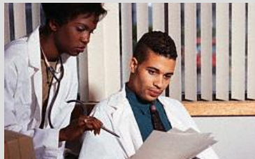
Registro Civil nas maternidades: objetivo louvável.

que deve ser privilegiado, cabendo aos agentes a obrigação de "fazer acontecer", mesmo que para isso tenham que incluir certas salvaguardas devido a exceções e casos fortuitos. Eu, de minha parte, estou antevendo que este sistema de coleta será muito custoso. A DeMaria está desenvolvendo um sistema de Registro Civil (começando pelo Nascimento) que permi-