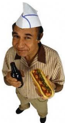
Vendedor de cachorro-quente: fazê-lo pagar imposto, eis o desafio.

É certo dizer que o nosso país está melhorando a cada dia que passa. Temos de comemorar, afinal os anos 80 e 90 foram marcados em grande parte por perdas e retrocessos. Mas o crescimento em 2004 deveu-se a fatores externos favoráveis, que não devem se repetir este ano, segundo os entendidos em economia. Eu, pobre mortal, empresário há muito tempo, gosto de usar outro termo para me definir: empreendedor. Outros adjetivos caberiam, como batalhador, teimoso ou louco. Isso porque, se a gente aqui embaixo se vira mais do que "charuto da boca de bêbado", lá nas castas dominantes reina a idéia de que o Brasil pode esperar sempre mais um pouco. Ando acreditando ultimamente que a coragem, farta nos meios empresariais, está escassa no mercado político. Está faltando arrojo e liderança para capitanear mudanças mais cruciais e enérgicas. É certo que, uma mini-reforma é melhor que nenhuma reforma, mas quando teremos as reformas estruturais de verdade? O Judiciário é um que já deveria ter adotado a tal súmula vinculante há muito tempo. O presidente do STJ, Ministro Edson Vidigal, a defendeu como antídoto contra o excesso de processos acumulados nas cortes superiores. "A súmula vinculante não deve ficar restrita apenas ao Supremo Tribunal Federal (STF), deve ser estendida a todos os demais tribu-