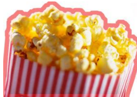
Pipoca: metamorfose pelo fogo

transformar em outra coisa — voltar a ser crianças! Mas a transformação só acontece pelo poder do fogo. Milho de pipoca que não passa pelo fogo continua a ser milho de pipoca, para sempre. Assim acontece com a gente. As grandes transformações acontecem quando passamos pelo fogo. Quem não passa pelo fogo fica do mesmo jeito, a vida inteira. São