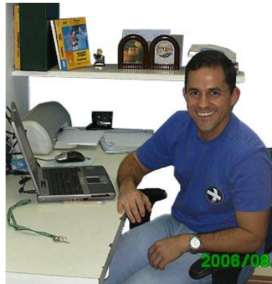
Substituto Emar, no CAISM

Em visita à serventia de Registro Civil do distrito de Barão Geraldo, Campinas, interior do Estado de São Paulo, em 23-08-2006, pudemos conferir o funcionamento do software DOC-Web , o único a oferecer a real solução para um sistema on-line de registro de nascimento em maternidades. Pode parecer simples, mas no Estado de SP costuma-se operar o registro civil nos hospitais através da coleta das informações e entrega da certidão somente no dia seguinte, após a declaração assinada pelo pai ou mãe ser devidamente processada no sistema "off-line" do cartório. Com o DOC-Web o Cartório de Barão Geraldo, em parceria com 3 maternidades da região (que cedem espaço e conexão com internet), emite a certidão na hora. Confira os dados: