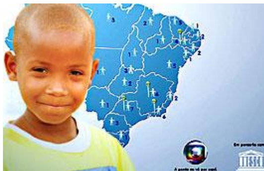
Criança Esperança da Rede Globo e UNICEF: confiável

Globo, que repassa o valor como doação para UNICEF, mas o lança a débito do seu imposto de renda! Bem, aí temos de ter cuidado com essa mania de boatos. Parece que não é bem assim. Segundo pesquisa em um blog (aqueles diários particulares na internet),