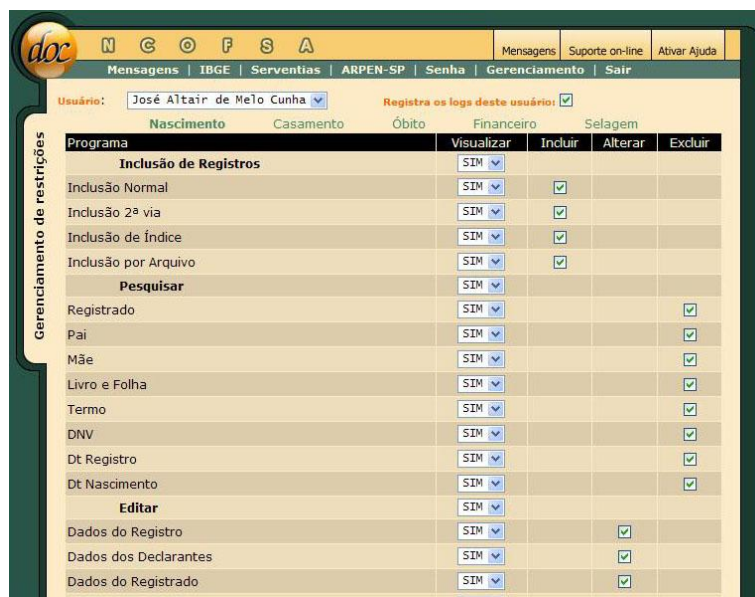
Gerenciamento de usuários: agora é possível controlar o que o usuário pode fazer e o que ele já fez!