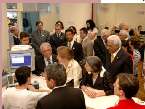
Ministra Ellen Gracie durante a implantação do sistema Projudi em MG

por meio eletrônico. Desta maneira simplificar o trabalho adicional que o Oficial e seus prepostos vinham fazendo para digitar no sistema do CNJ tudo o que já haviam registrado no software DOC-Desktop. O provimento de 7 de maio de 2008 entrou em vigor na data da publicação.